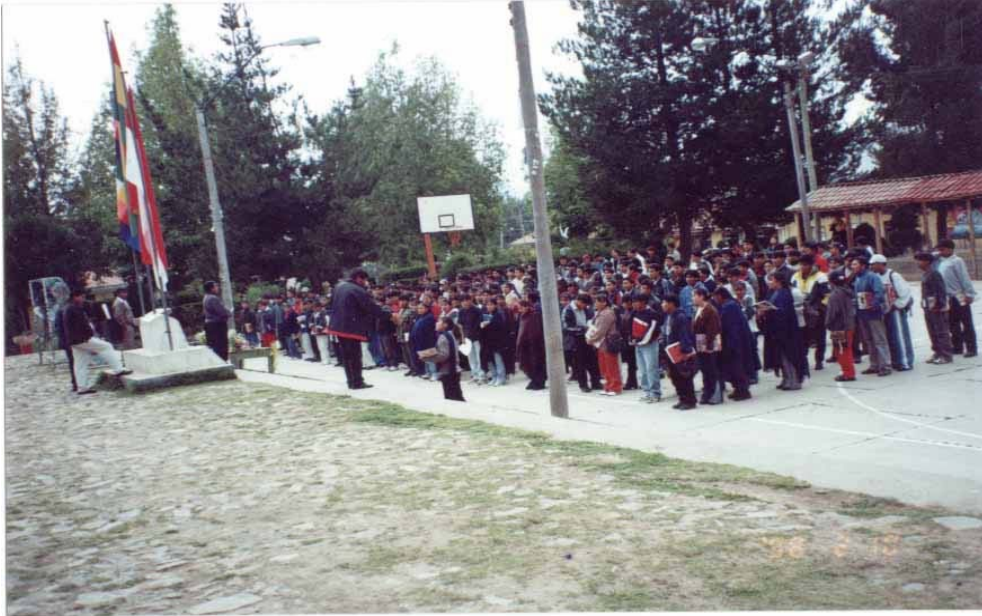
La concentración de futuros docentes en el patio del INS-EIB Vacas.