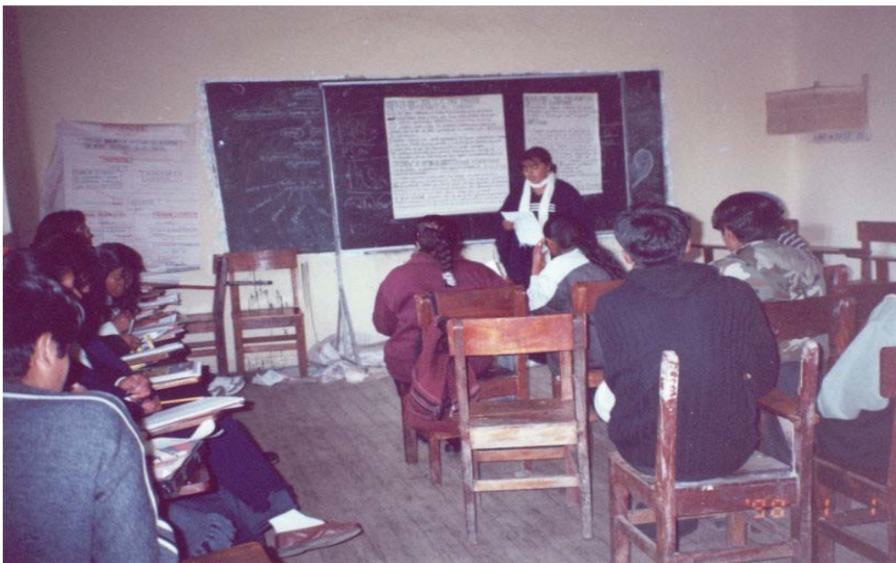
Exposición de un tema de lenguaje por parte de una estudiante 2º C.