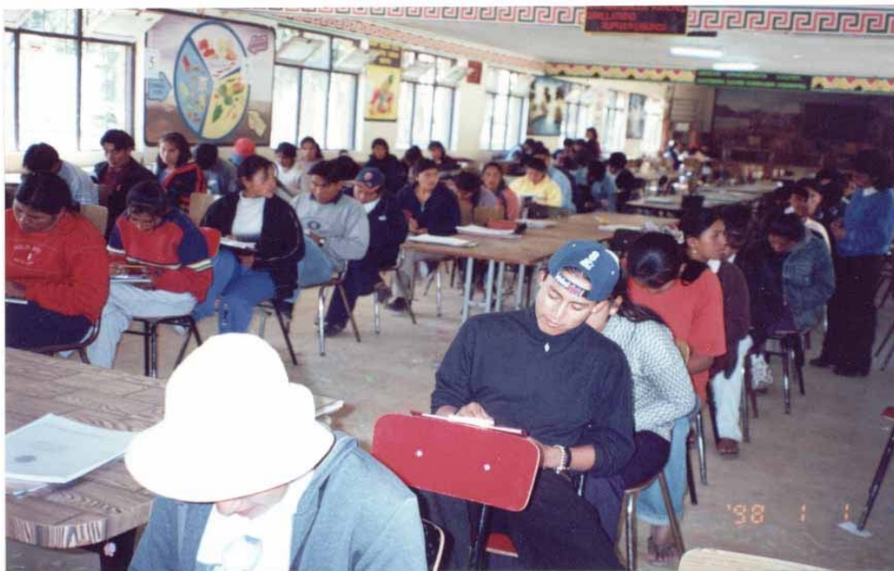
El poder-saber en el examen de lenguaje