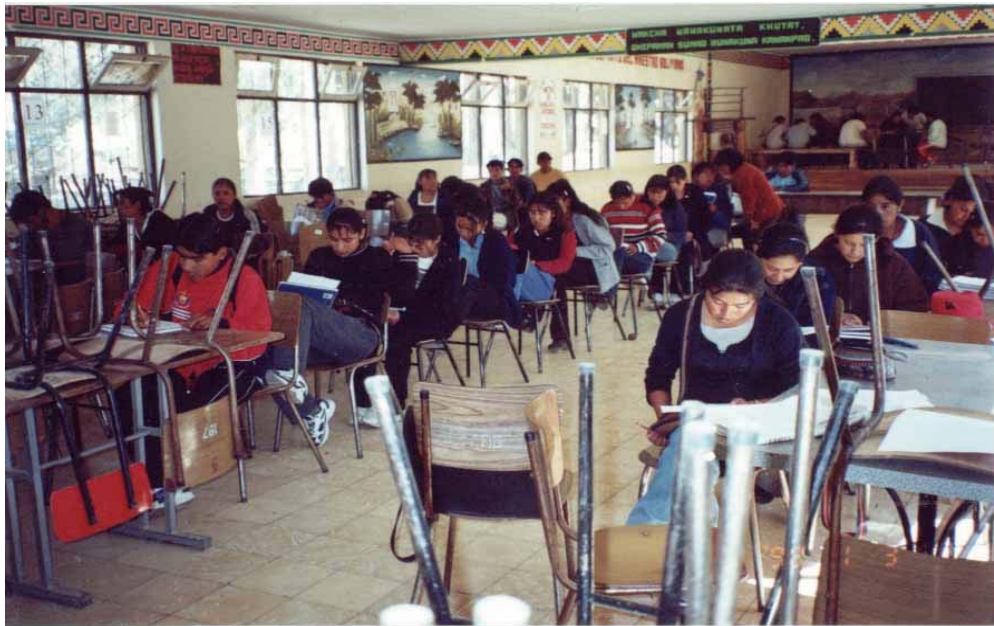
Un tipo de poder disciplinario en el aula de lenguaje (1º semestre)